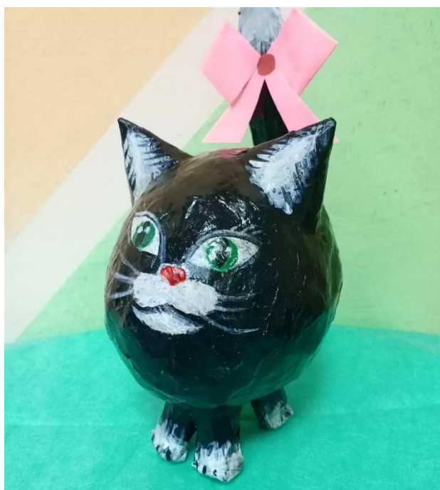
Рихтер Настя, 7 лет